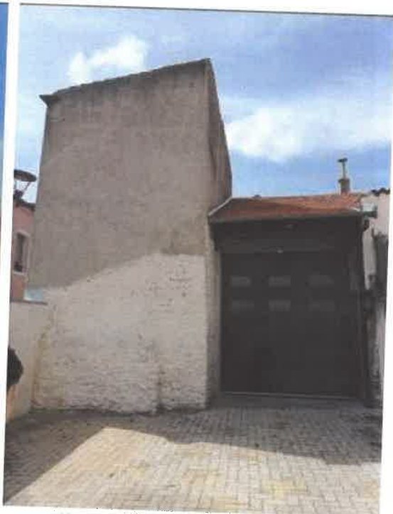
Pignon Est et mitoyenneté Nord